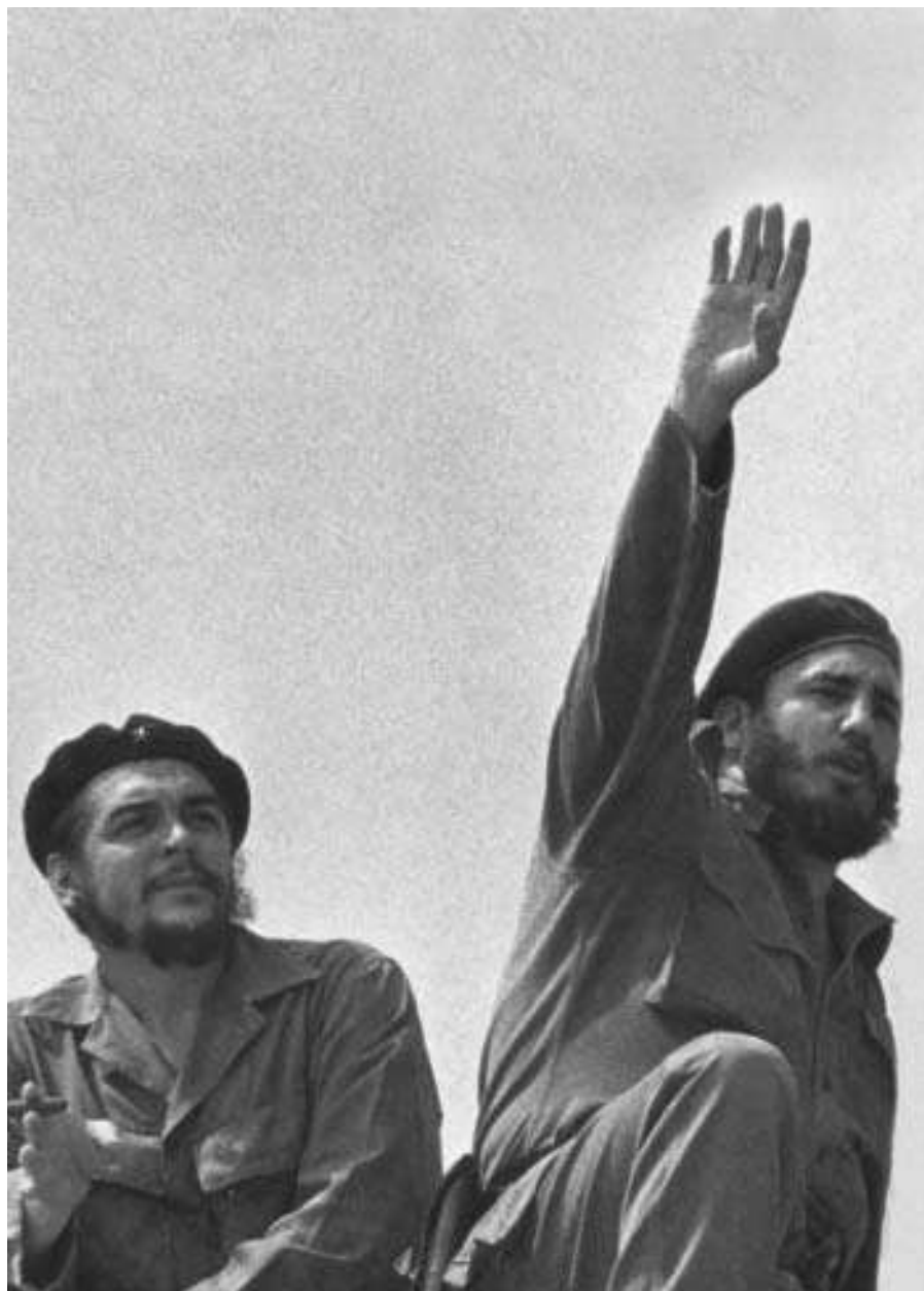
Presenciando el desfile del 1 de mayo, La Habana, 1963