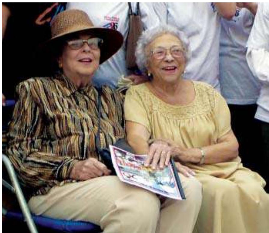
Vilma Espín y Melba Hernández en el acto por el 46 aniversario del 26 de Julio, Ciego de Ávila, 2001