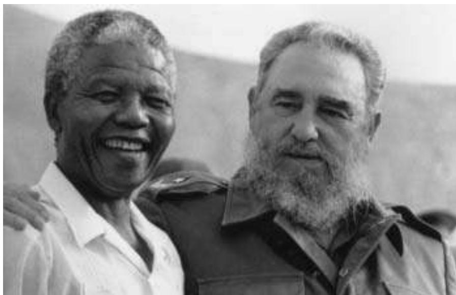
Nelson Mandela y Fidel, 1991