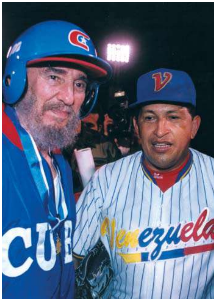
Junto a Chávez en el juego de pelota, La Habana, 2001