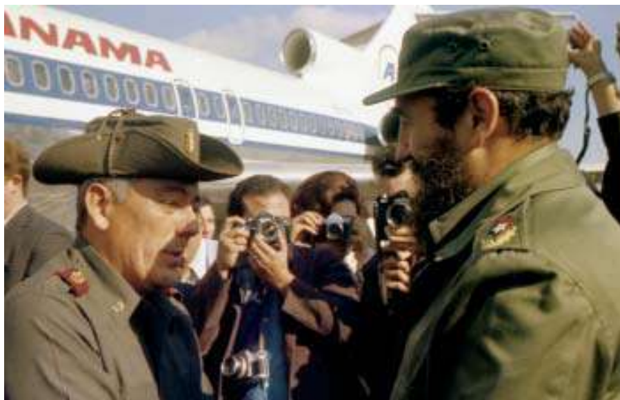
En el recibimiento a Omar Torrijos, La Habana, 1976