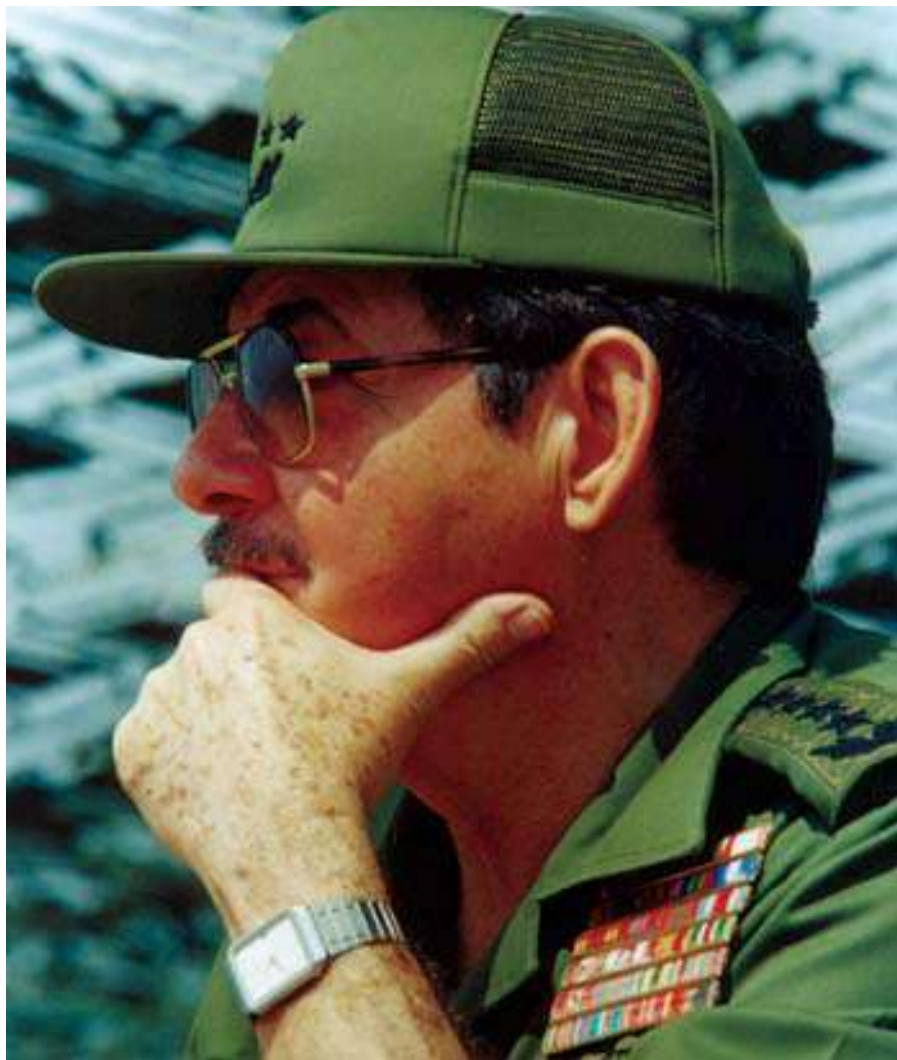
General de Ejército, Raúl Castro Ruz