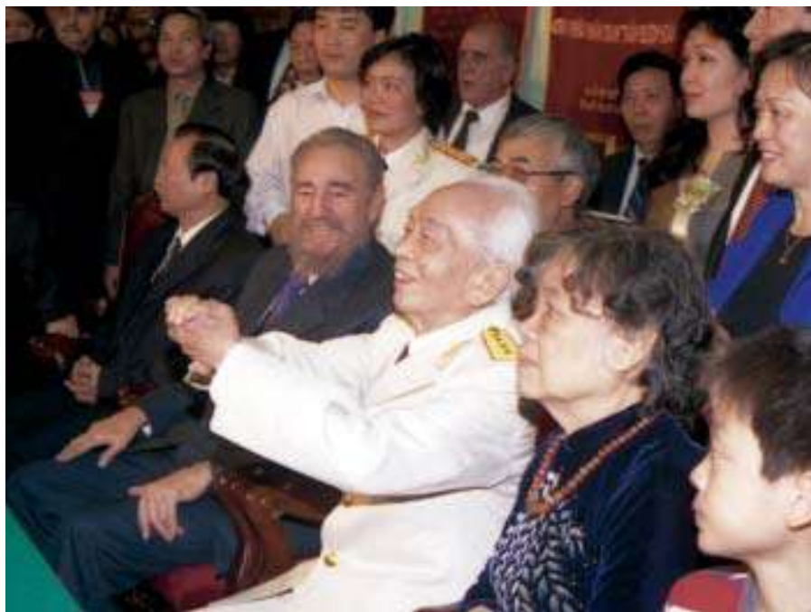
Junto al General Vo Nguyen Giap, Vietnam, 1995