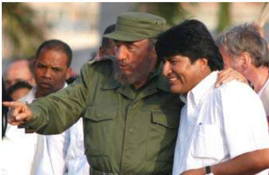
Junto a Evo Morales, La Habana, 2005