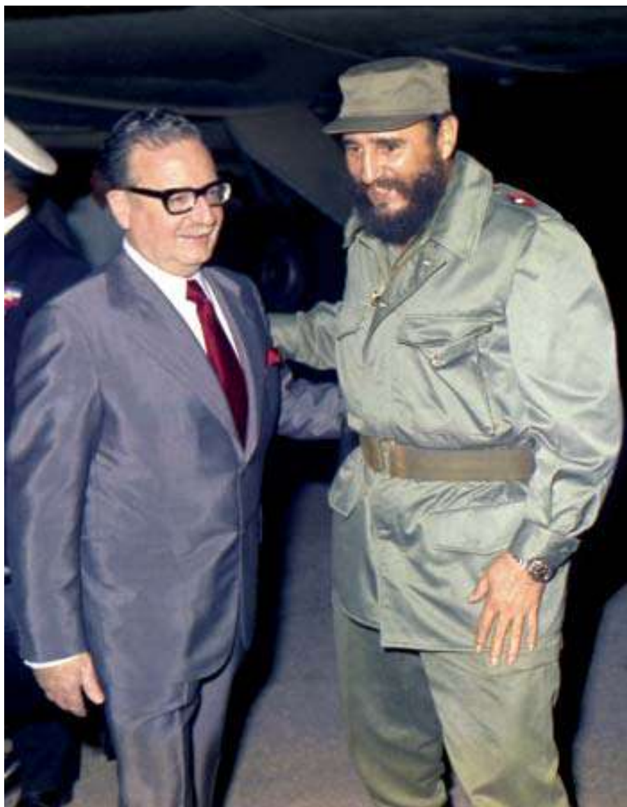
Durante la visita de Salvador Allende, La Habana, 1972