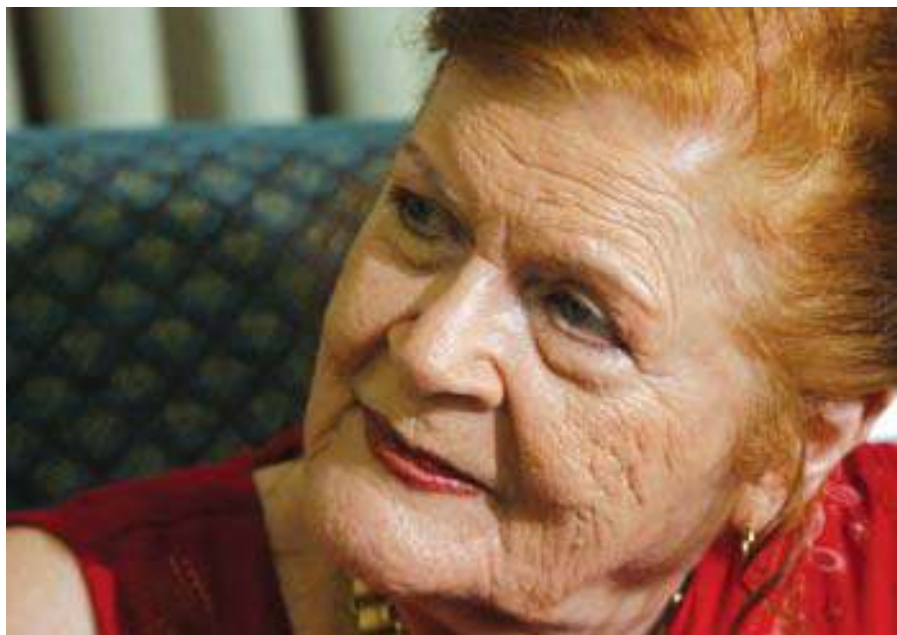
Carilda Oliver Labra