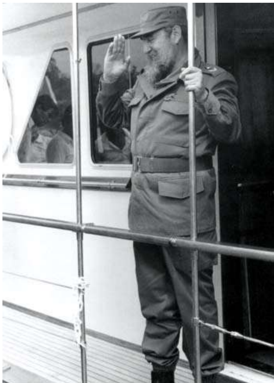
En el yate Pájaro Azul, Bahía de Cienfuegos, 1987