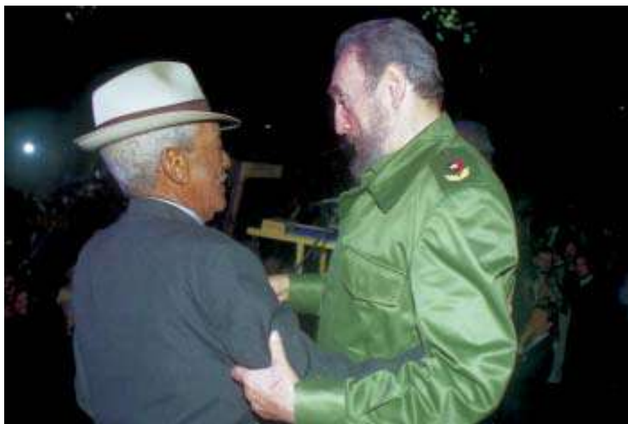
Saluda a Francisco Repilado (Compay Segundo), 2001