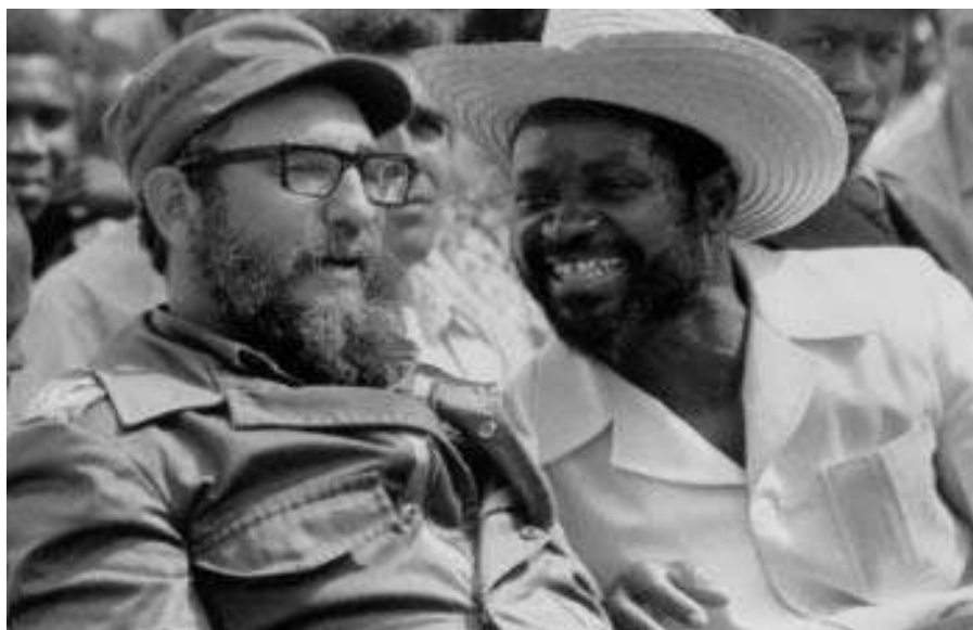
Con Samora Machel (Mozambique), Isla de la Juventud, 1977