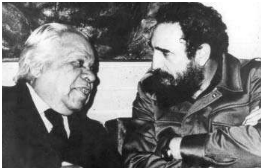
Junto al Poeta Nacional, Nicolás Guillén, 1970