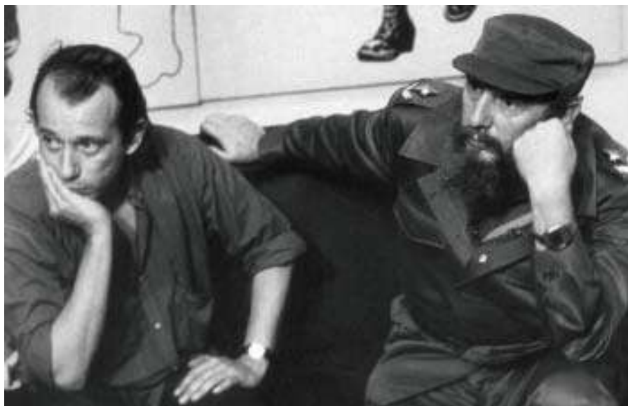
Junto a Silvio Rodríguez, en la Casa de las Américas, La Habana, 1984