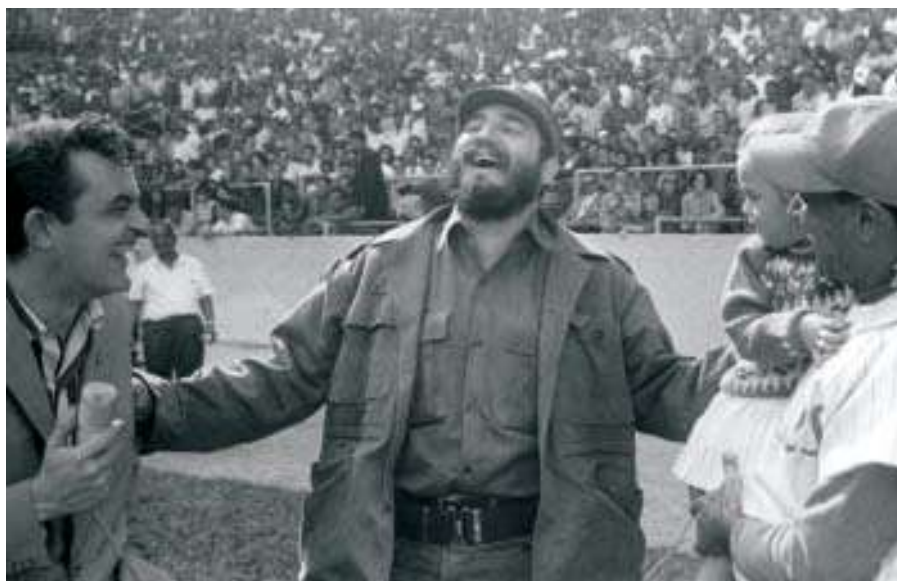
En la inauguración de la V Serie Nacional de Pelota, en unión del narrador deportivo Eddy Martín, Estadio Latinoamericano, 1966