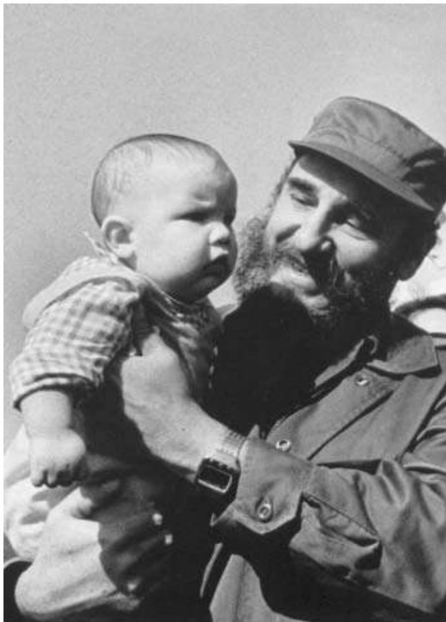
Con el hijo de Pierre Trudeau (Canadá), La Habana, 1976