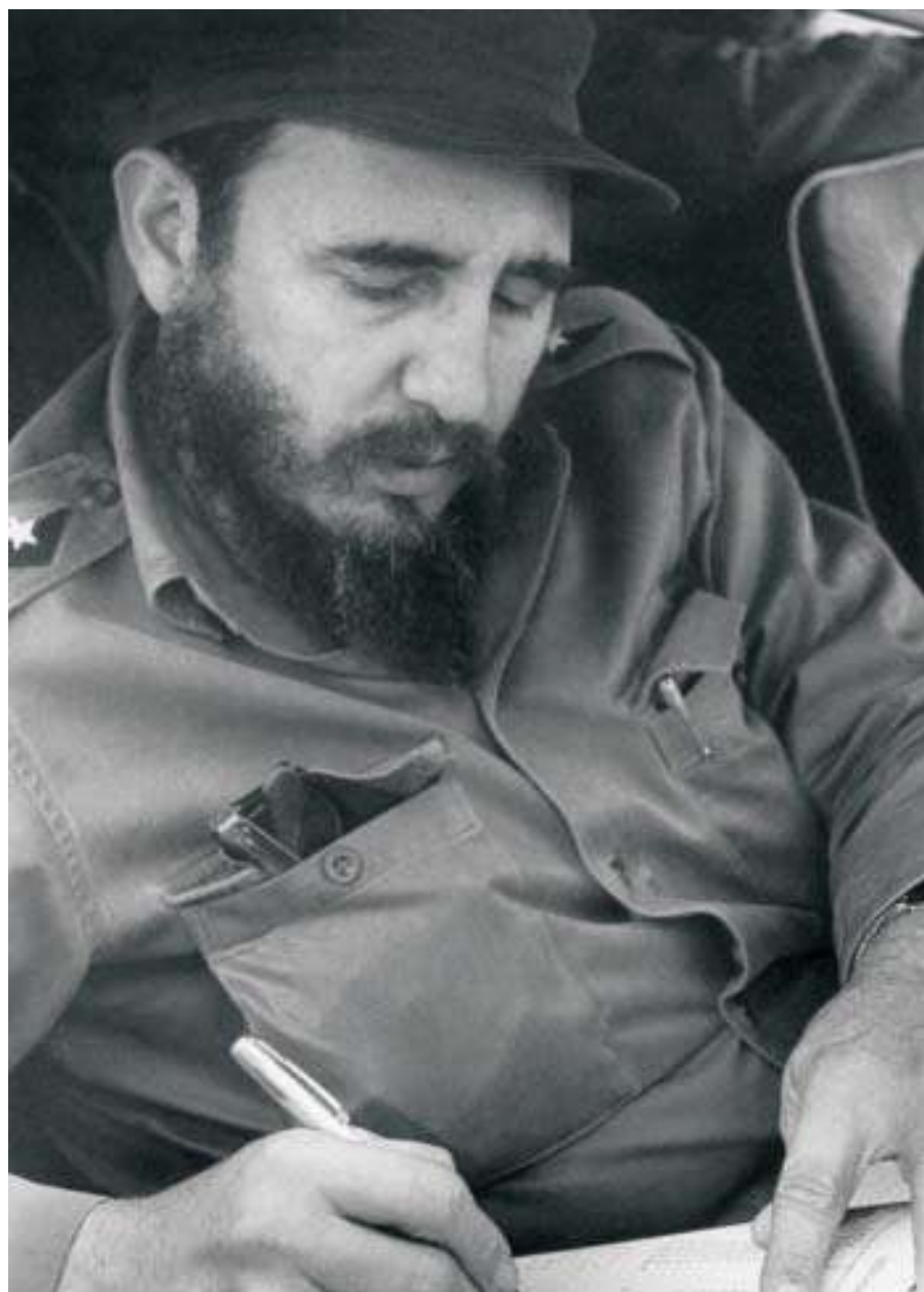
Fidel, febrero, 1970