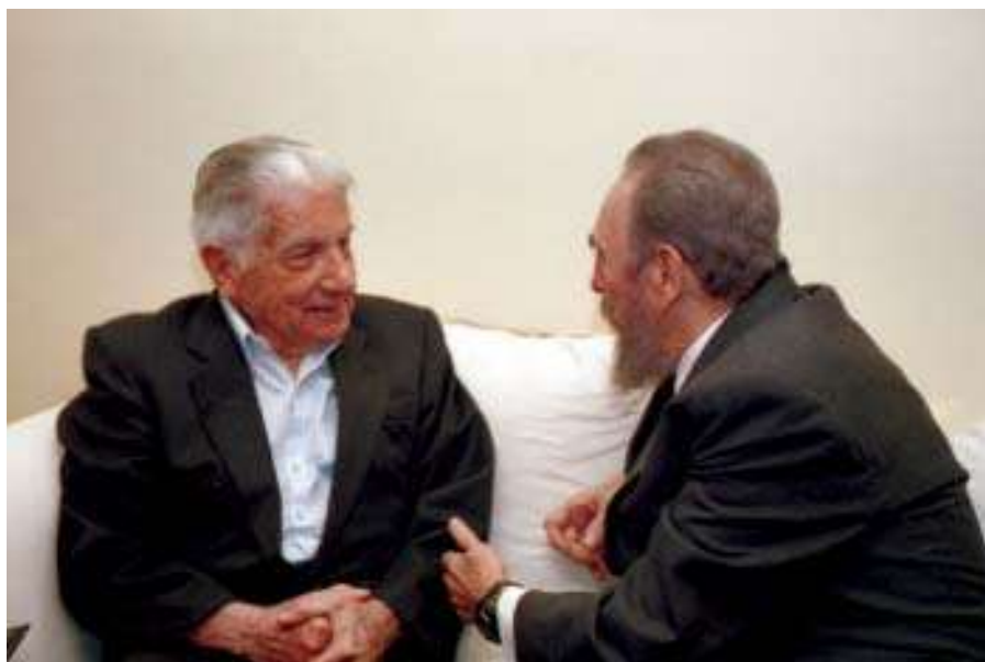
Conversando con el escritor Augusto Roa Bastos, Paraguay, 2003