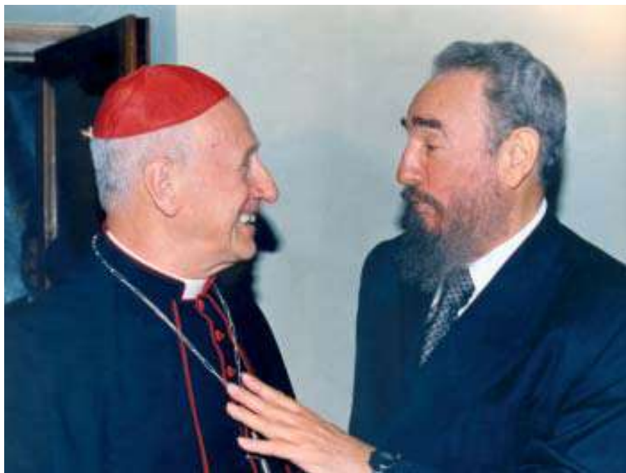
Junto al Cardenal Roger Etchegaray, Vaticano, 2000