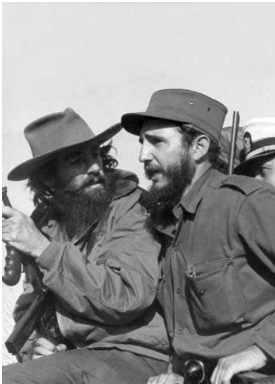
Entrada en La Habana, 8 de enero de 1959