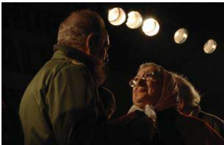
Con Hebe de Bonafine, Córdoba, 2006