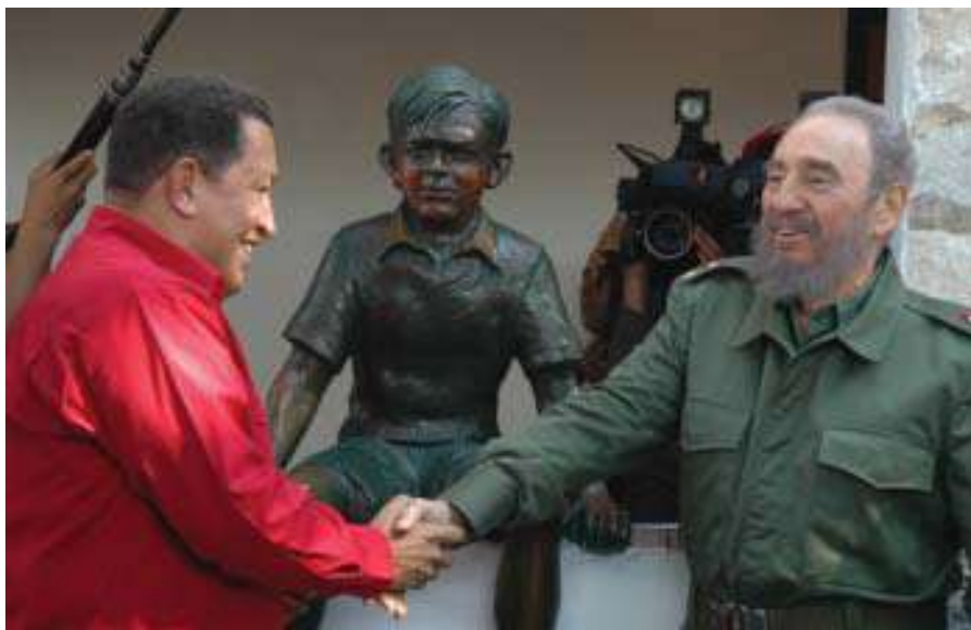
En la casa donde vivió el Ché, Córdoba, Argentina, 2006