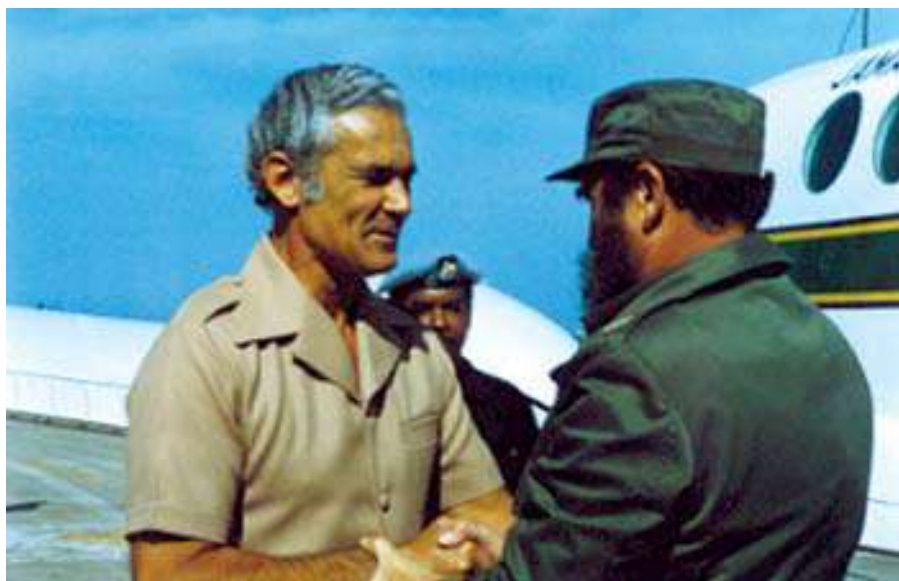
Junto a Michael Manley durante su visita a Jamaica, 1977