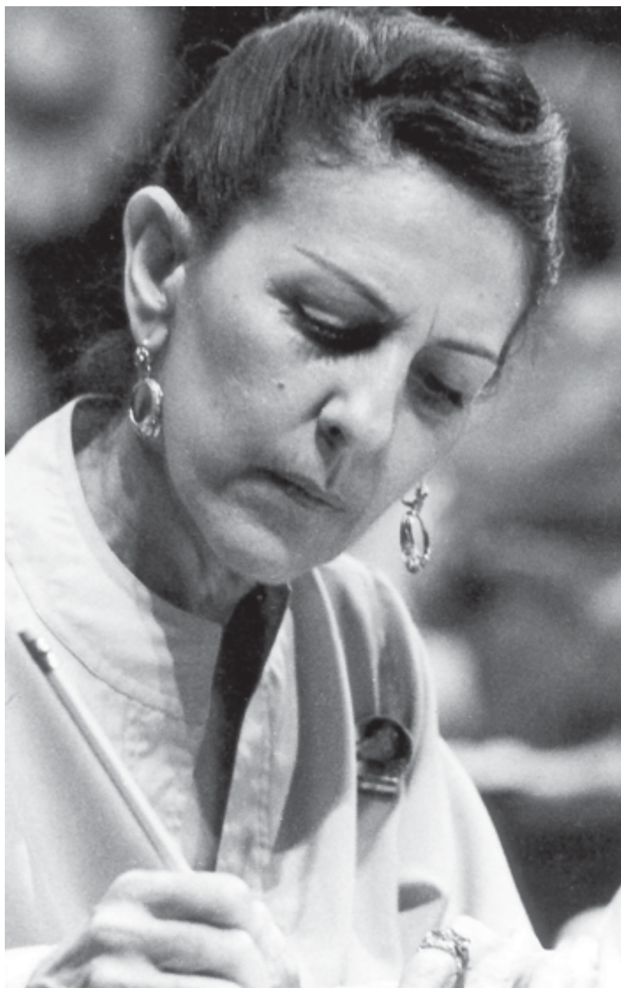
Celia Sánchez Manduley