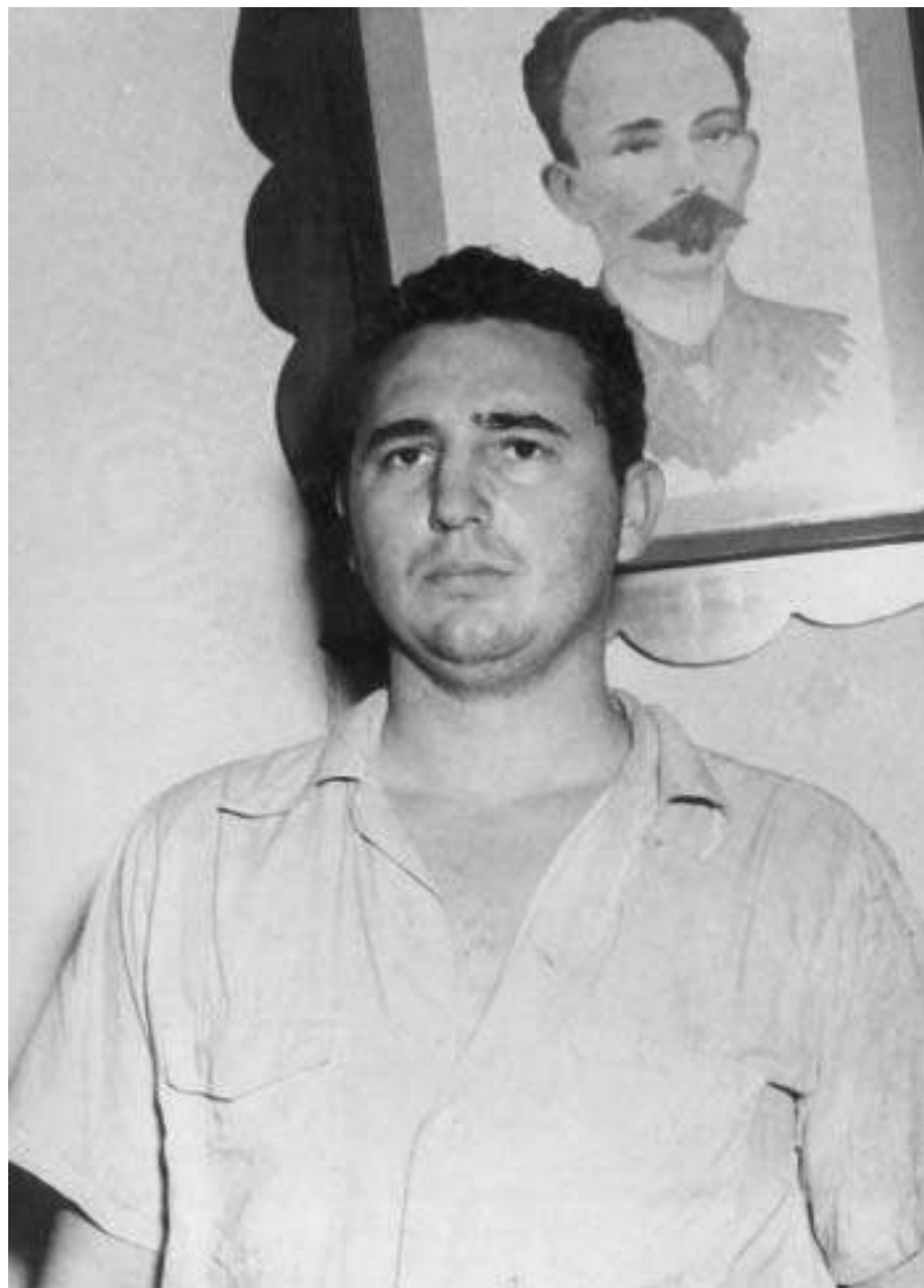
Fidel en el vivaque de Santiago de Cuba, 1953