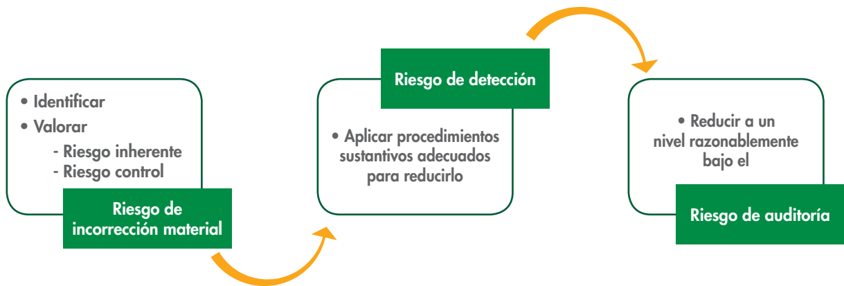
Figura 2: Estrategia general para reducir el riesgo de auditoría