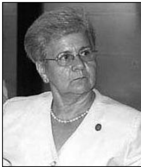
Gladys M. Bejerano Portela Vicepresidenta del Consejo de Estado Contralora General de la República