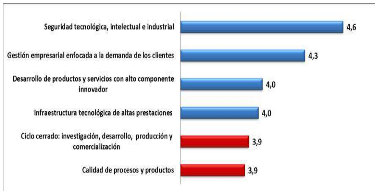
Figura 3. Valoración general de las variables de capital estructural en la industria cubana de software (Escala Likert 1-6).