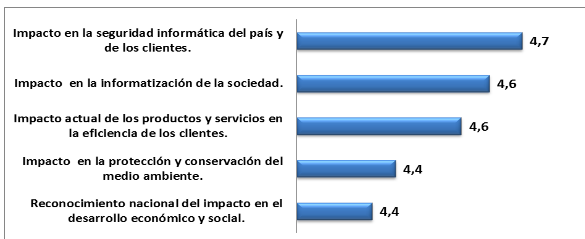
Figura 5. Valoración general de los elementos que caracterizan las variables de capital social en la industria cubana de software (Escala Likert 1-6).

Como resumen del diagnóstico general, a nivel de industria se puede señalar que la gestión de los intangibles es satisfactoria. El 64 % de los intangibles tienen una gestión aceptable y el 32 % es evaluado de regular. Solamente el 4 % de los intangibles presentan una mala gestión. Sin embargo, ninguno de los intangibles es gestionado bien o muy bien. Si recordamos que el éxito de cualquier industria está en la capacidad de generar valor como resultado de crear y desarrollar ventajas competitivas, es decir, competencias distintivas con relación a industrias similares, entonces resulta preocupante que la gestión de los intangibles, base de un