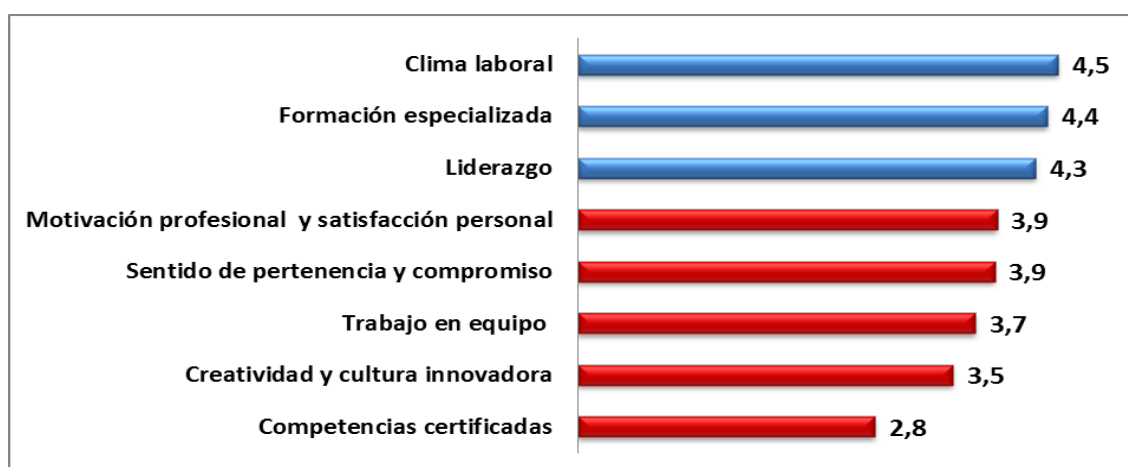
Figura 2. Valoración general de las variables de capital humano en la industria cubana de software (Escala Likert 1-6).